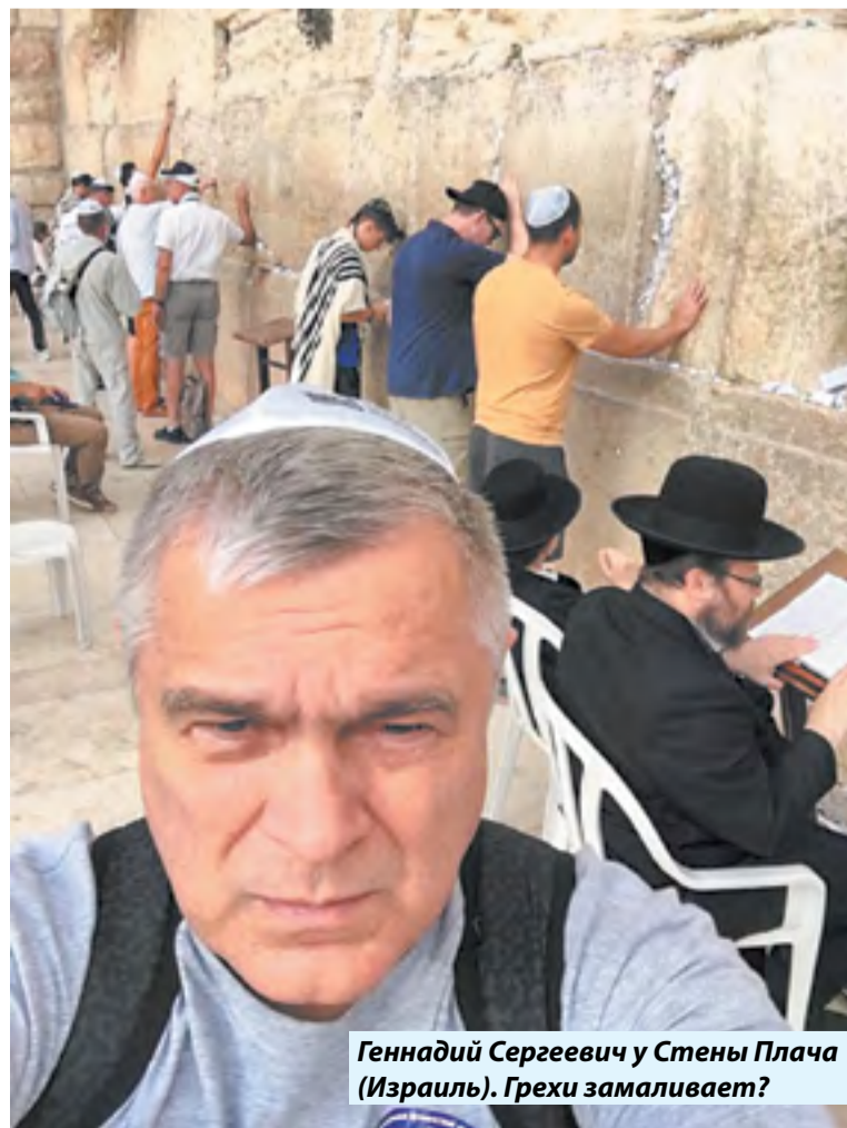
Геннадий Сергеевич у Стены Плача (Израиль). Грехи замаливает?

Считаем, что только Президент России может вмешаться в данную ситуацию и пресечь дальнейшее расхище-