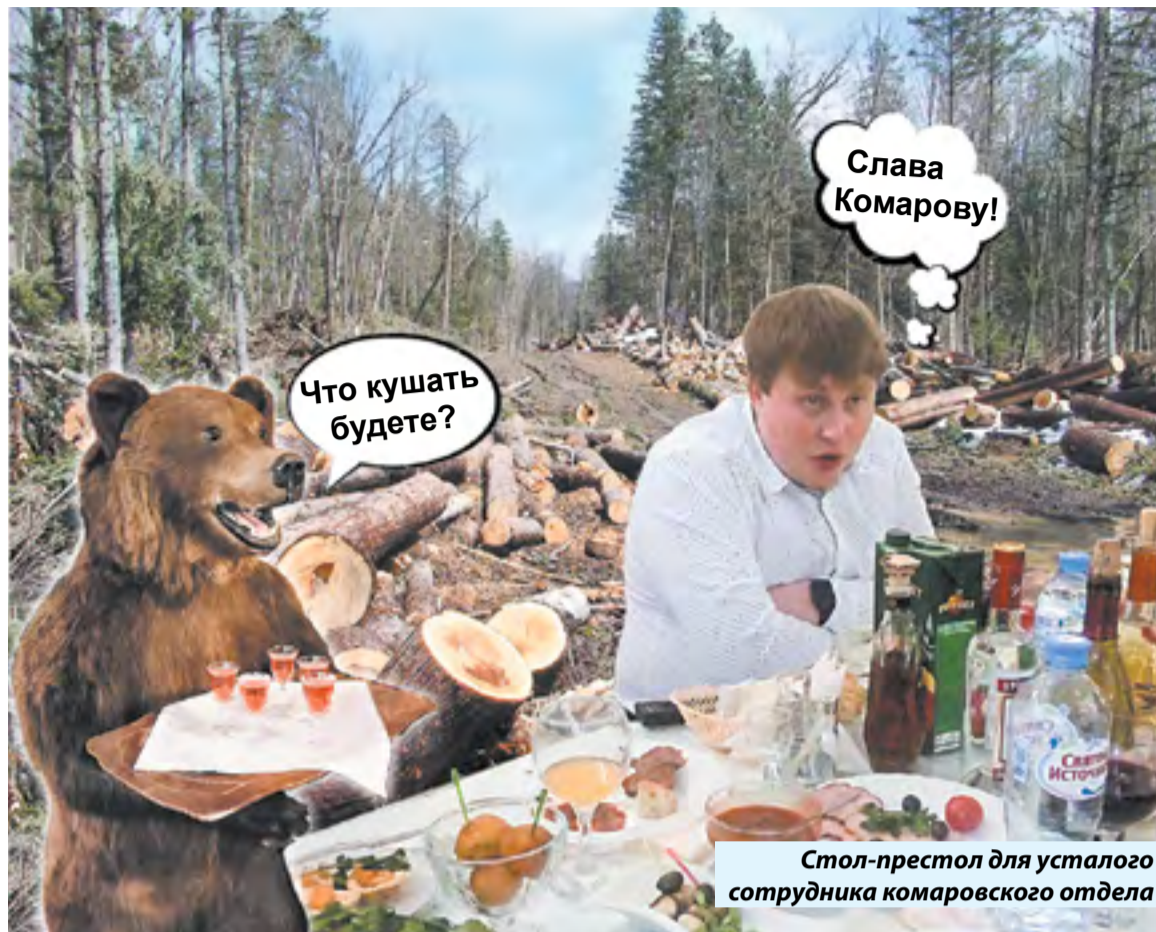
Стол-престол для усталого сотрудника комаровского отдела

– Знаете, депутаты, что бы о них ни говорили в народе (бездельники, дармоеды, купаются в роскоши за счет народа и т.д.), люди слишком занятые и часто бывает, что просто не знают тех, кто обращается к ним по различным вопросам. Или пересекались с кем-то пару раз, может, в предвыборный период или после на каком-нибудь мероприятии. Всех не запомнишь. Депутатская связь с общественностью происходит в основном через аппарат помощников. Все обращения регистрируются, готовятся ответы и принимаются меры. Бывает и такое, что бумаги подписываются не глядя. Депутат доверяет своим помощникам. Вот тут обычно «косяки» и случаются. Однажды через помощника одного очень известного депутата (фамилию по этическим соображениям не назову) протолкнули запрос в Министерство юстиции. Шум такой поднялся, что мама не горюй! Поз-